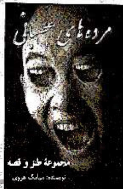
مجموعه طنز و قصه نویسنده: سیامک هروی