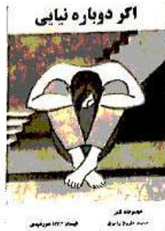
مجموعه شعر اگر دوباره نیایی محمد هارون راعون

اگر دوباره نیایی زبان حال شاعری است که بیشتر حرفهایش را عاشقانه می گوید؛ شاعری که خودش را در قالب خاصی محدود نکرده است. غزل، رباعی، دوبیتی، مثنوی، تصنیف و شعر آزاد در جای جای مجموعه ۱۱۷ صفحه ای آقای هارون به چشم می خورد. هارون درباره خودش می گوید: «مادرم بر بالای بستر ما به جای لالایی، حضرت مولانا و بیدل و حافظ می خوانده... هیچ ودیعه ای را مقدس تر از آزادی نمی پندارم، ولی بنده خداوند عشقم.»